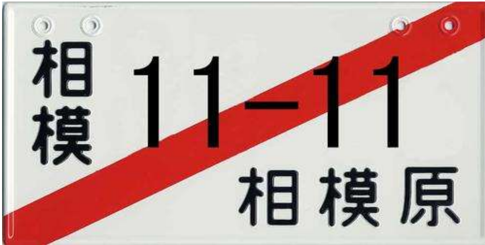
Pic. 4 Example of rental plate